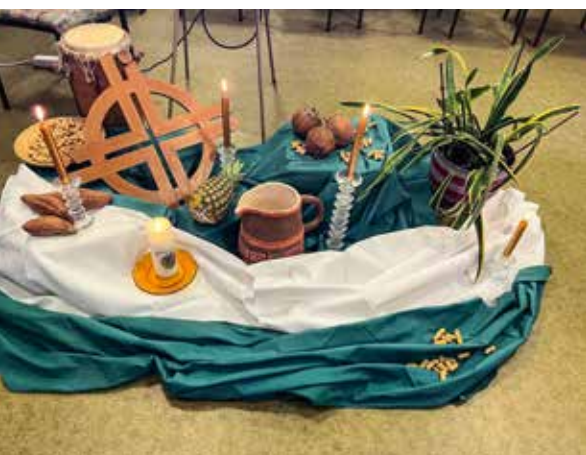
Liebevolltes Arrangement mit landestypischen Symbolen

Am 6. März feierten katholische und evangelische Christinnen im Pfarrheim St. Peter den Weltgebetstag der Frauen – diesmal mit Fokus auf Nigeria. Von Sylvia von Scheidt