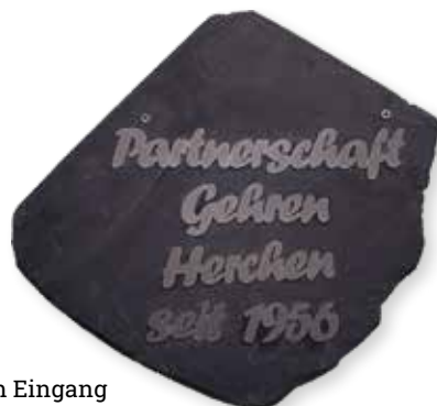
Schiefertafel am Eingang des Gemeindehauses in Herchen

Was bleibt ist, unsere Kirche zusammen mit dem Förderverein weiter zu erhalten und bekannt zu machen, unsere Gemeinde zu stärken sowie auch unsere fortwährende Freundschaft mit unserer Partnergemeinde Herchen zu pflegen. Und dabei wird uns unser unerschütterlicher Glaube an Gott helfen.