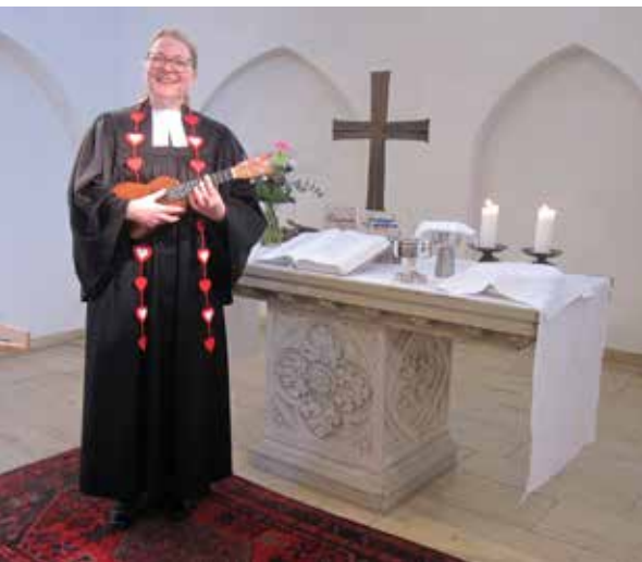
Mit der Ukulele im Gottesdienst – darf dat dat? Un dat dat dat darf!