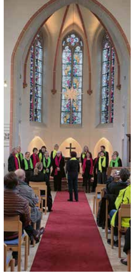
Ein Gotteslied voller Licht und Klang.

und es wurde gebannt gelauscht. Zum besonders guten Gelingen trug auch der schöne Gesang des Chores »Frauen3Klang« bei. Auf dem Altar wurde von unserer Küsterin Jessica Werner bei der ersten Strophe von: »Wir sagen euch an den lieben Advent« die erste Kerze entzündet und aus der Sakristei strahlte der heruntergelassene Herrnhuther Stern.