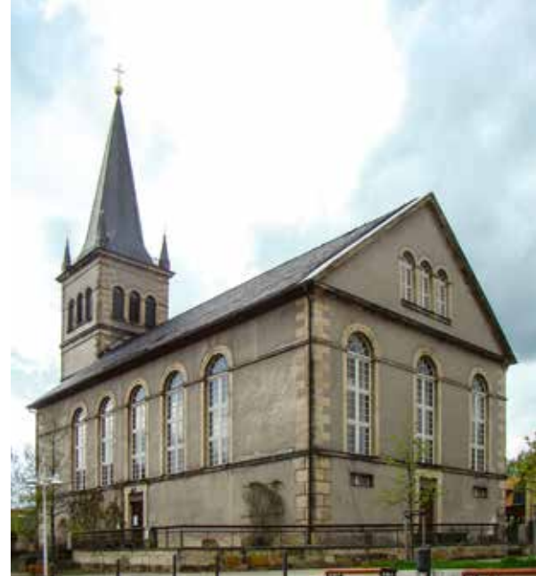
Die Schinkel-Normalkirche in Gehren

Auf unserer Homepage www.schinkel-normalkirche-gehren.de finden Sie viele Informationen